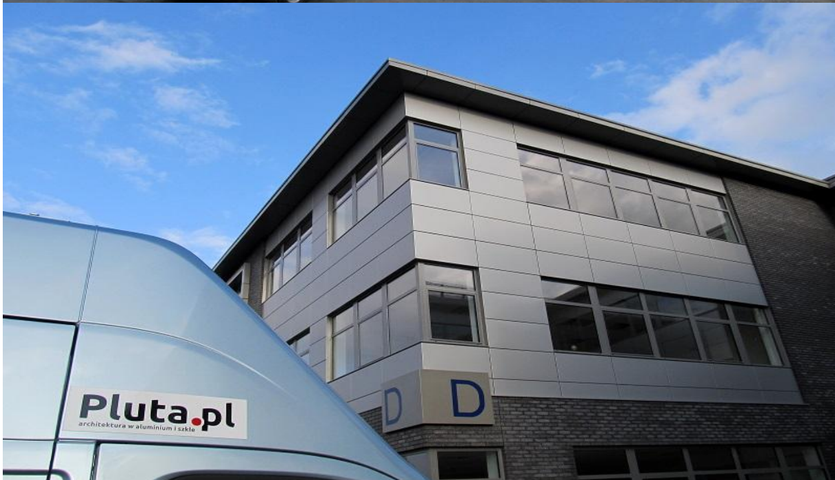
DIAMOND BUSINESS PARK Ursus / Warszawa 2015

ul. Domaniówka 1 C, 25-413 Kielce, POLSKA ul. Warszawska 49 / 44, 25-531 Kielce, POLSKA