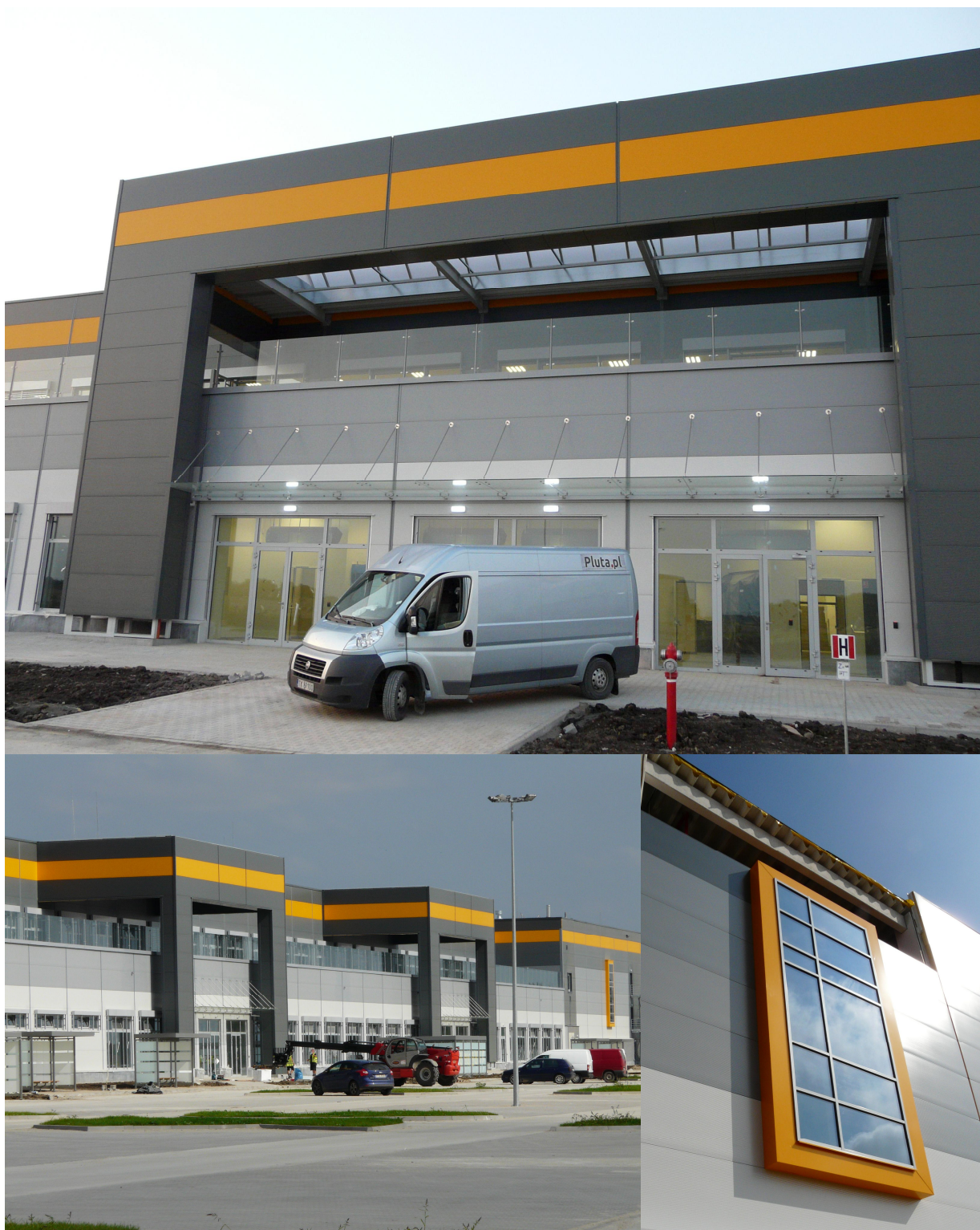
AMAZON Bielany Wrocławskie / Wrocław 2014

ul. Domaniówka 1 C, 25-413 Kielce, POLSKA ul. Warszawska 49 / 44, 25-531 Kielce, POLSKA