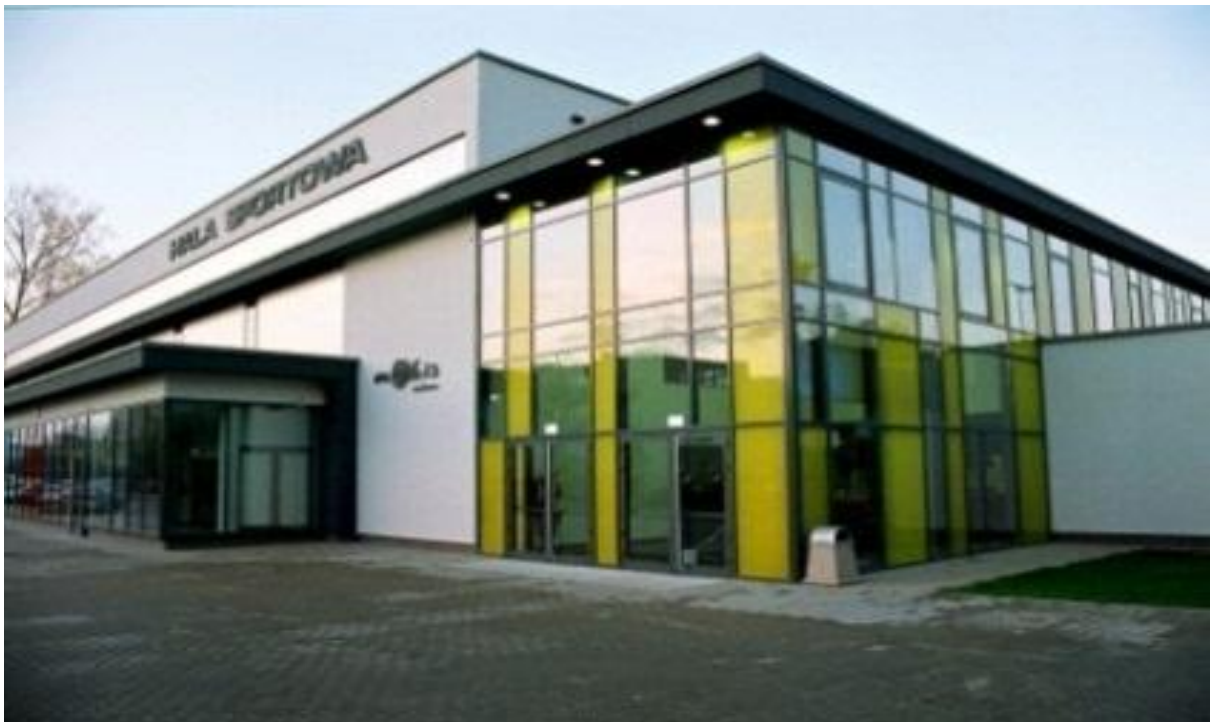
HALA SPORTOWA Oleśnica 2009