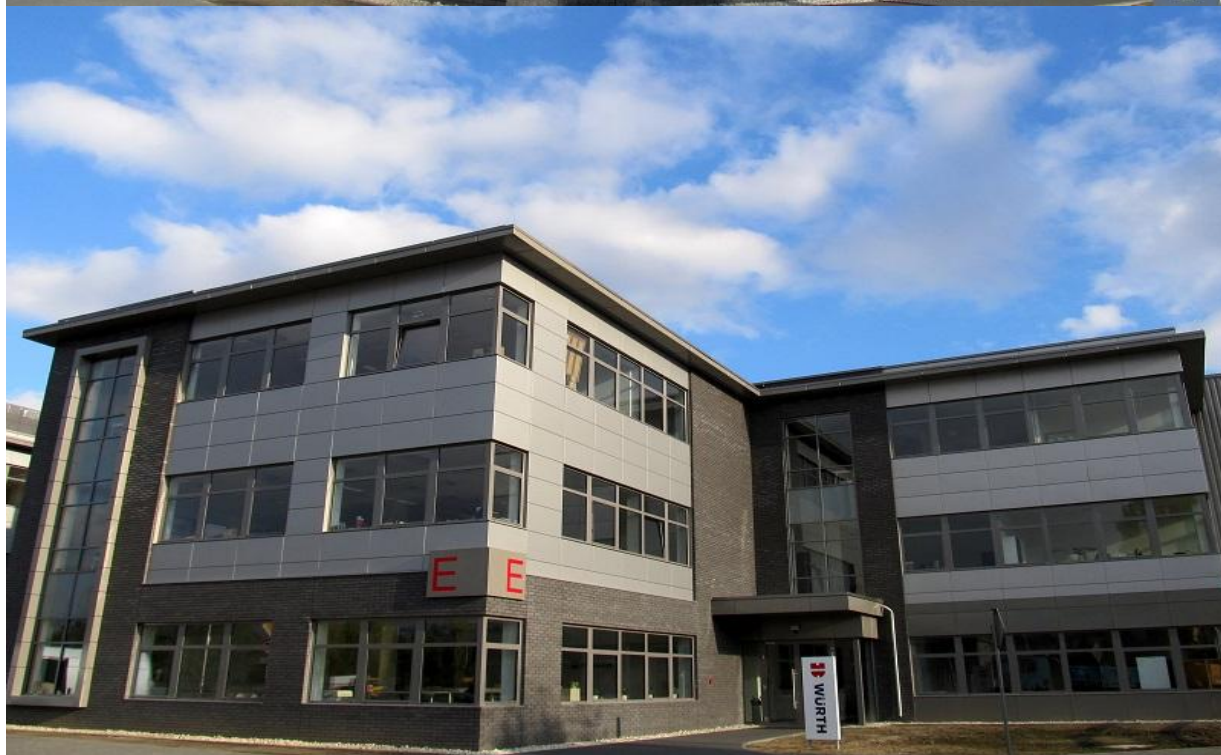
DIAMOND BUSINESS PARK Ursus / Warszawa 2015

ul. Domaniówka 1 C, 25-413 Kielce, POLSKA ul. Warszawska 49 / 44, 25-531 Kielce, POLSKA